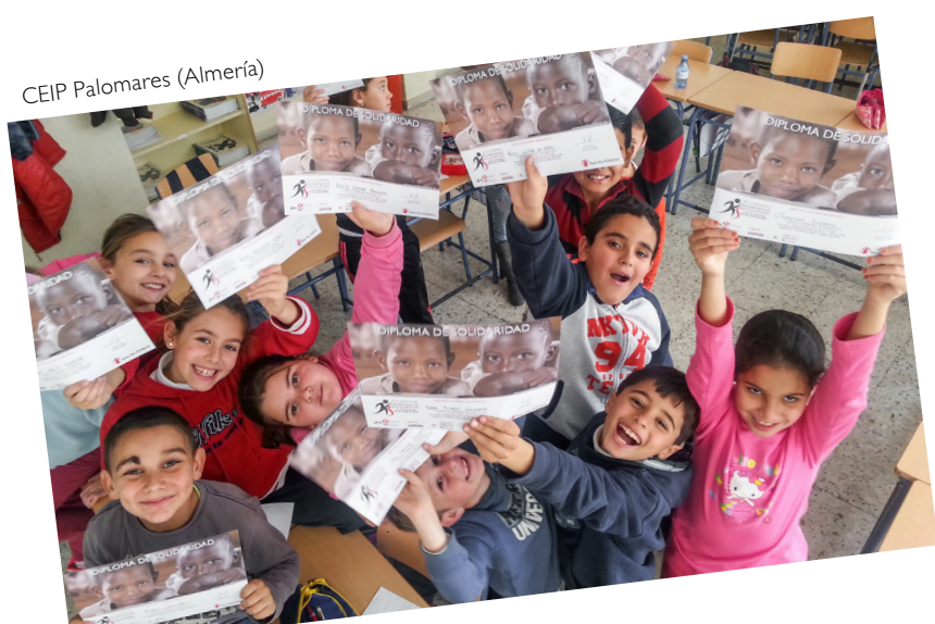
CEIP Palomares (Almería)

La participació activa comporta un aprenentatge proactiu, la sensibilització pròpia i de l'entorn, la recerca de patrocinadors per transformar l'esforç en fons per fer realitat els programes de cooperació i el moment concret de la cursa. En aquesta, l'esforç físic s'uneix a l'entusiasme i el compromís amb altres per aconseguir aquest objectiu comú: la solidaritat amb els infants més vulnerables.