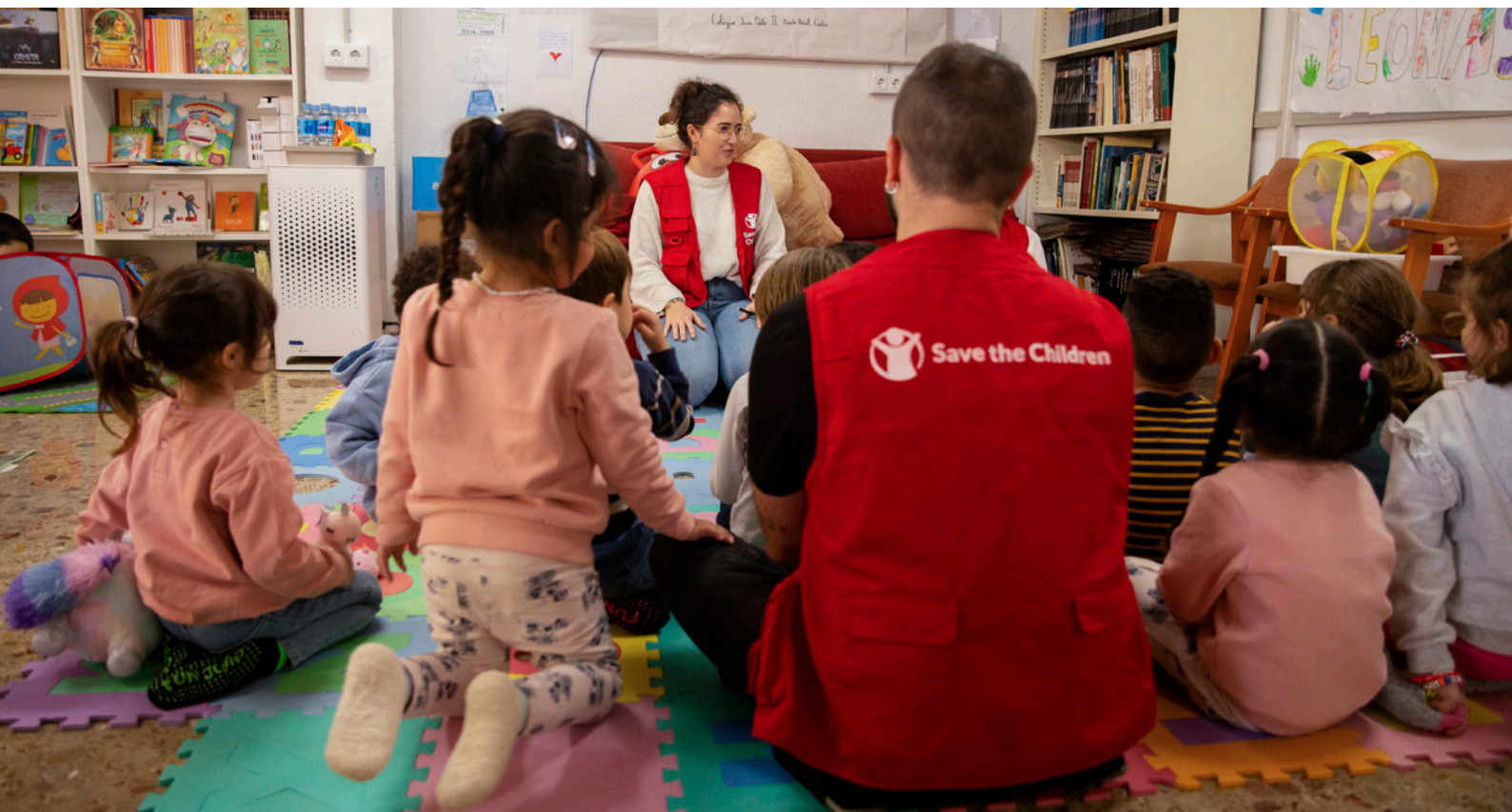
Pie de foto: Niños y niñas en el Espacio Seguro y Amigable para la Infancia de Sedaví junto a parte del equipo de Save the Children.